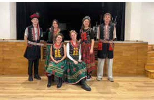
IntegraART w Mydlnikach

Więcej informacji na stronie www.mydlniki.dworek.eu