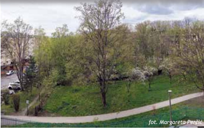
fot. Margareta Perčić