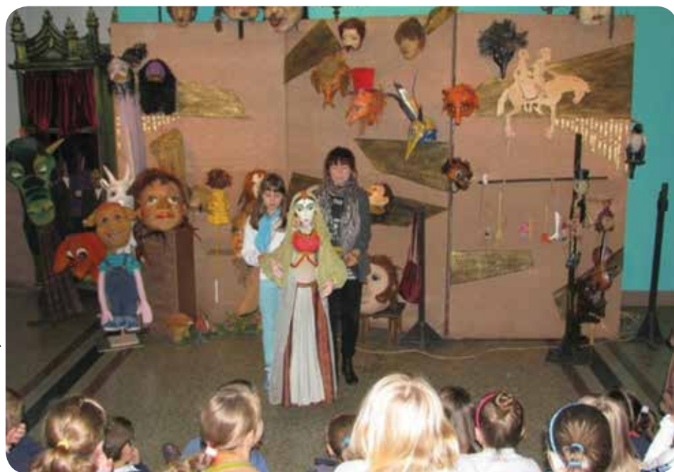
Lekcja teatralna w „Grotesce”

W maju 2014 roku Rada Pedagogiczna Szkoły Podstawowa nr 138 im. Polskich Wojsk Lotniczych w Krakowie – Mydlnikach podjęła decyzję o nawiązaniu międzynarodowej współpracy z Międzyszkolnym Ośrodkiem Języków Ojczystych w Eskilstunie (Szwecja). W ramach realizowanego w obu ośrodkach projektu: „Moje korzenie – co nas łączy? Co nas dzieli?” przewidziana jest partnerska wymiana uczniów oraz całoroczne interdyscyplinarne warsztaty.