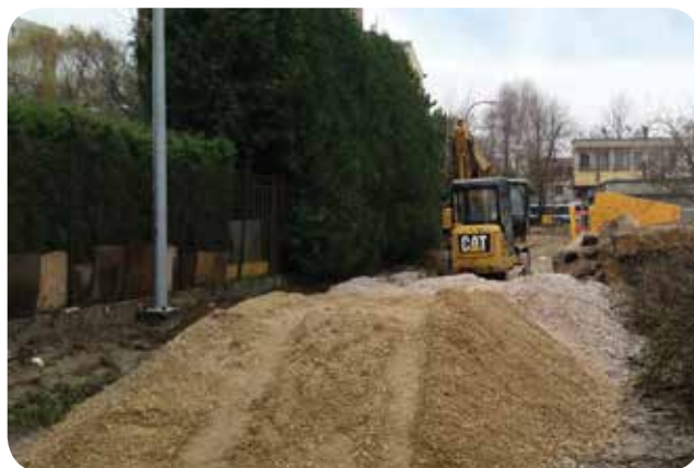
Ulica Racheli w przebudowie