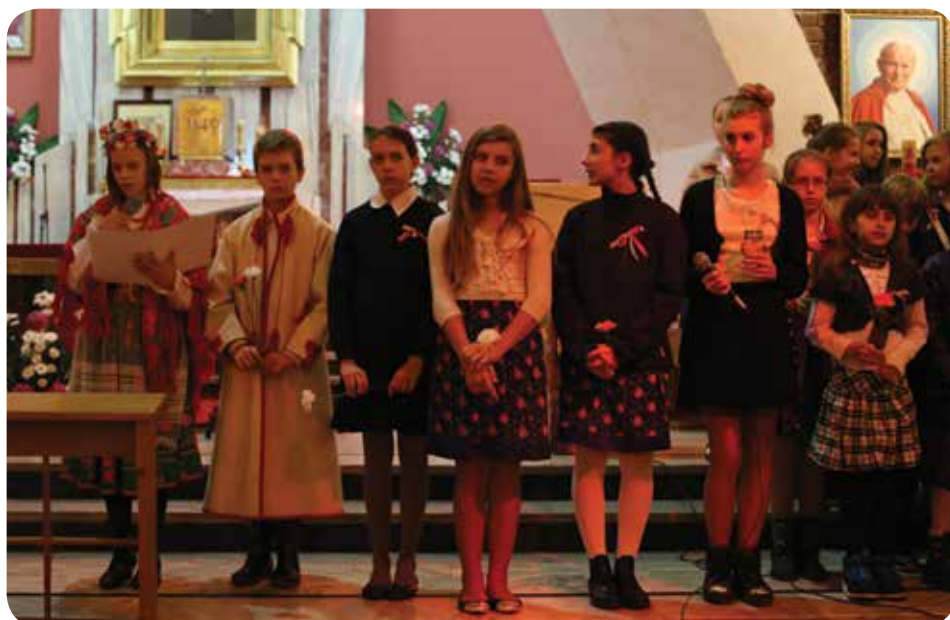
Występ młodych artystów, ich zaangażowanie i autentyczność udzielił się zgromadzonemu