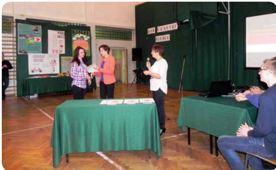
Tematem sesji była transplantacja

29 października 2014 roku w Zespole Szkół Geodezyjno-Drogowych i Gospodarki Wodnej w Krakowie już po raz szósty spotkaliśmy się w ramach sesji „Zdrowy Styl Życia”. Poprzednie spotkania dotyczyły właściwego odżywiania, aktywności fizycznej, szkodliwości palenia papierosów oraz profilaktyki nowotworowej.